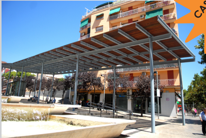
PÉRGOLA FRANCESC LAYRET 3.000 m2 de tratamientos aplicados