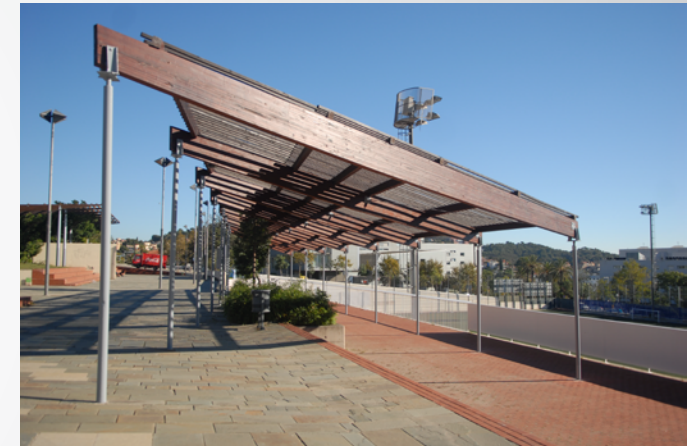
PÉRGOLA ALFONSO COMÍN Más de 600 m2 tratados